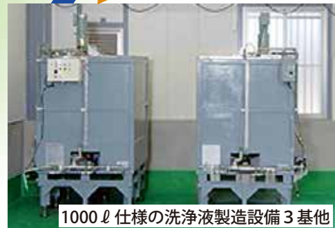
1000ℓ仕様の洗浄液製造設備3基他