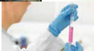
<洗浄液の研究開発>