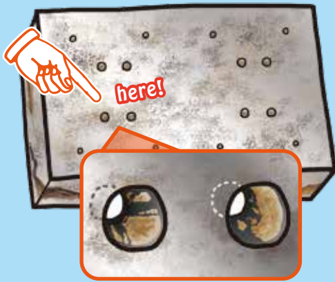
エジェクタピン穴