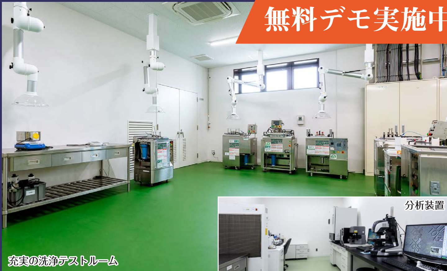
充実の洗浄テストルーム